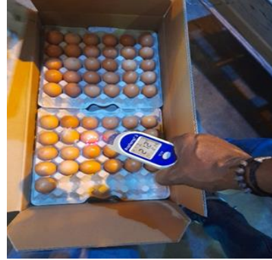
ඡායාරූප අංක 46 - නෙදර්ලන්තයෙන් රැකුම් බිත්තර ආනයනය කිරීම புகைப்பட எண் 46: பெற்றோர் இருப்பு விருத்திக்காக நெதர்லாந்தில் இருந்து முட்டைகளை இறக்குமதி செய்தல்.