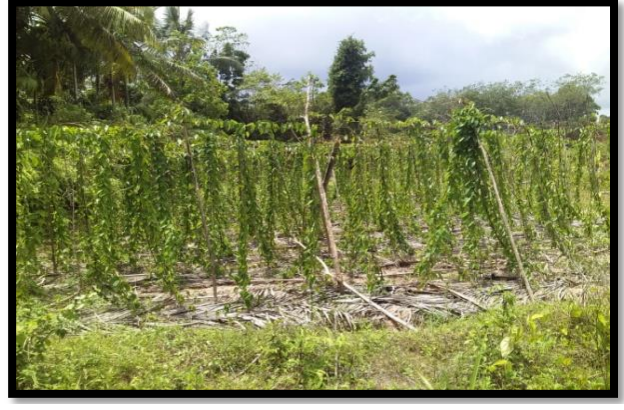
ஊராட்சி அங்க 02 - ஊராட்சி நிர்வாகம் மற்றும் தொழில்நுட்ப ஊக்குவிப்பு விநியோக வகையின் செய்கையை ஊக்குவிக்கும் நிகழ்ச்சித் திட்டம்

Photo No.1: Crop cultivation in protected