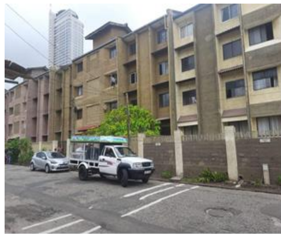
ඡායාරූප අංක 47 - කොළඹ හා තදාසන්න ප්‍රදේශවල නිවාසවලටම නැවුම් එළ කිරි උදාසන හා සවස් කාලයේ සැපයීමේ වැඩසටහන புகைப்பட எண். 47 - கொழும்பு மற்றும் புறநகர் பகுதிகளில் உள்ள வீடுகளுக்கு காலையிலும் மாலையிலும் புதிய பசும்பால் வழங்கும் திட்டம்.