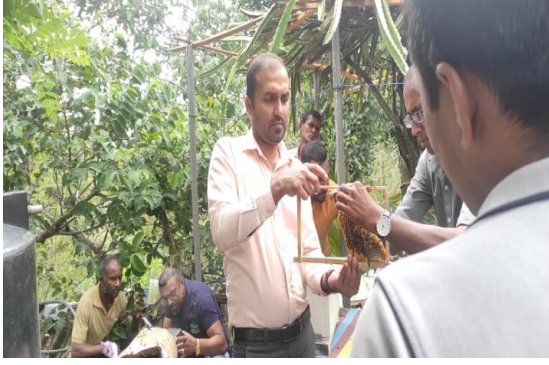
ඡායාරූප අංක 04 - බිඟු සම්පත් සුරැකීම හා පිරිසිදු මී පැණි විදේශීය වෙළඳපොළ වෙත ඉදිපත් කිරීමේ ව්‍යාපෘතිය ප්‍රකාශනය. 04 - தேனி வளப் பாதுகாப்பு மற்றும் சுத்தமான தேனை வெளிநாட்டு சந்தைகளுக்கு ஏற்றுமதி செய்வதற்கான நிகழ்ச்சித் திட்டம்