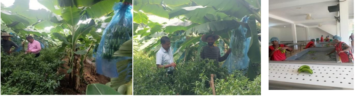
ඡායාරූප අංක 15 - මොනරාගල කැවෙන්ඩිෂ් කෙසෙල් පොකුර පූකෙප්පඩ எண்-15: கவென்டிஷ் வாழை கொத்தணி, மொனராகலை Photo No-15: Cavendish banana cluster, Monaragala