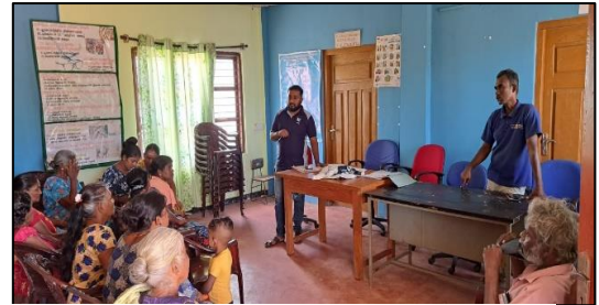
ඡායාරූප අංක 58: තාක්ෂණික පුහුණු වැඩසටහන, සෙට්ටිකුලම් පෙරියකට්ටු ඉම නිලධාරී වසම புகைப்பட எண் 58: தொழில்நுட்பப் பயிற்சித் திட்டம், செட்டிகுளம் பெரியகட்டு கிராம அலுவலர் பிரிவு