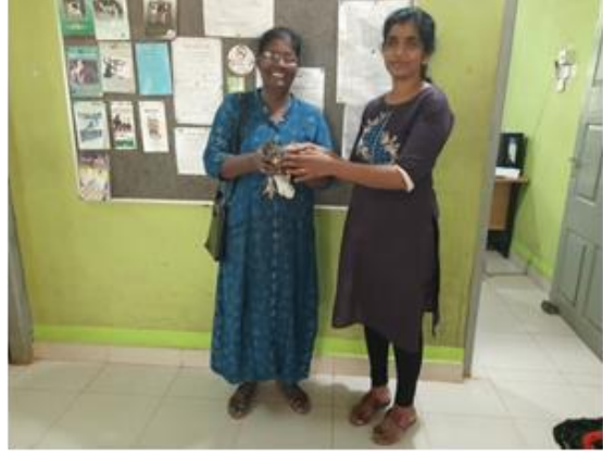
ඡායාරූප අංක 10 - කුඩා හා මධ්‍ය පරිමාණ කුකුළු ගොවිපොළ සංවර්ධනය - උතුරු පළාත ප්‍රකාශනය - 10: සීරියා මඟින් සහ අනෙකුත් අලුත්වන කොමිටි වැනි වැනි ප්‍රජා සංවිකල්ප අවිකල්ප - වැනි සංවිකල්ප Photo No-10: Development of small and medium scale poultry farms- Northern Province