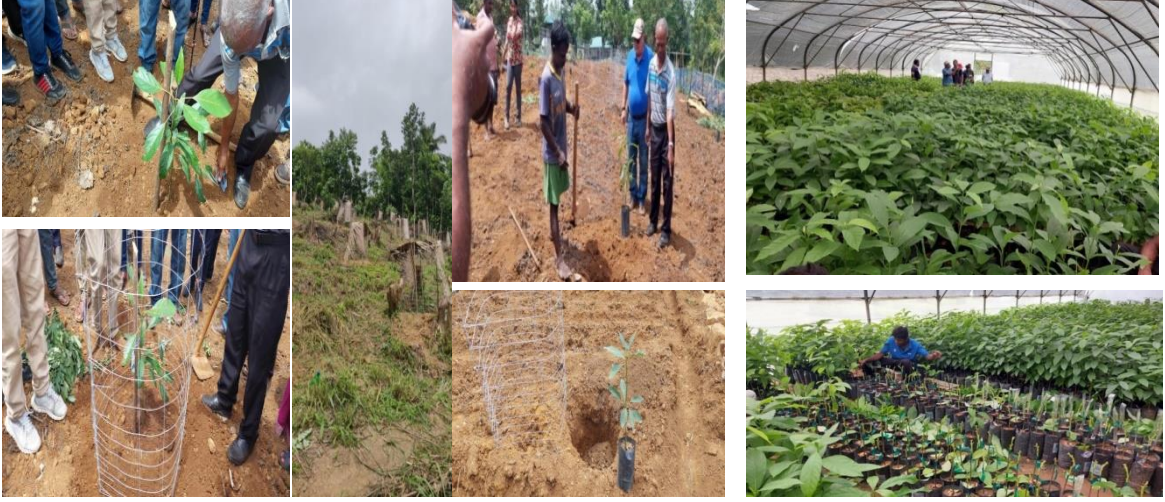
ජායාරූප අංක 12 - බදුල්ල සහ මහනුවර ප්‍රදේශයේ Hass අලිගුට පේර පොකුරු පිහිටුවීම புகைப்படம் எண்-12: பதுளை மற்றும் கண்டி மாவட்டங்களில் ஆனைக்கொய்யா கொத்தணிகளை நிறுவுதல் Photo No-12: Establishment of Avocado clusters in Badulla and Kandy

விவசாயத் துறையை நவீனமயமாக்கும் செயற்திட்டம் (ASMP) Agriculture Sector Modernization Project (ASMP)