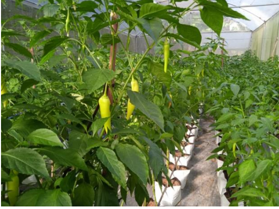
ஊராட்சி அங்க 01 - டிசைன் செய்யப்பட்ட தூய்மை வாய்ந்த புகைப்பட எண் 01 - தென் மாகாணத்தில் பாதுகாக்கப்பட்ட இல்லங்களில் பயிற்சி செய்கைகள்

Photo No.1: Crop cultivation in protected