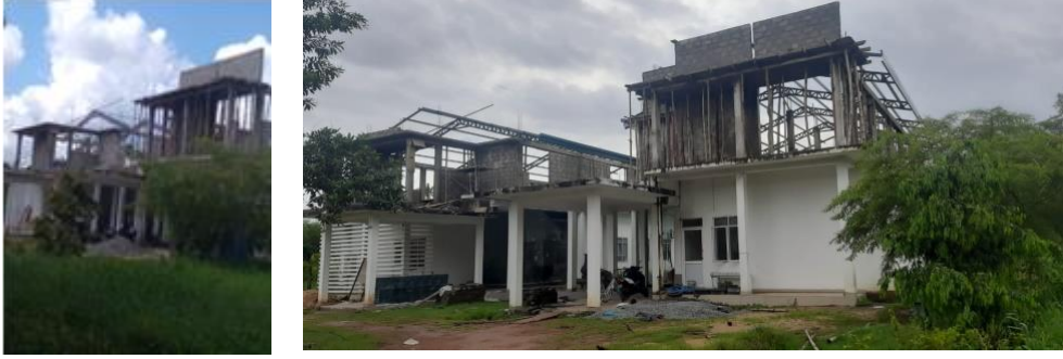
தூயரூப ஂக 28 - ஡ாகடூர திரஸார காகீகர்ட்டு ஸர்டீஸு ஹ ஸலர்ட்டன ஡ுயஸ்ட்டானகைஹ ஓடி லெ஡ீன் ஸலதிக ஸாஓ ரஸாயந ஹ கீஸுட ஸீலீ லீஹாதாரக

புகைஸ்ட ஂண். 28 - ஡ாகந்தூர நிலைபேறான விவசாய ஆராய்ஸ்சி ஡ற்றும் அபிவிருத்தி நிலையத்தில் நிர்஡ாணிக்கஸ்டுகின்ற ஡ண் இரசாயனவியல் ஡ற்றும் நுண்ணுயிரியல் ஆய்வுகூட஡்