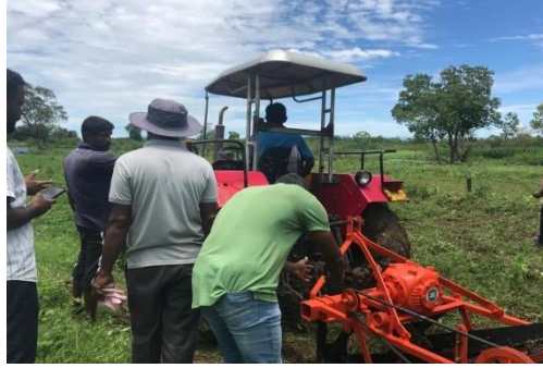
ඡායාරූප අංක 06 - විවිධ පාර්ශවයන්ගේ සහයෝගය ඇතිව නව නිපැයුම්කරුවන් සාර්ථක ව්‍යවසායකයින් බවට බලගන්වීමේ ව්‍යාපෘතිය, සංවර්ධන වැඩසටහන් අධීක්ෂණය සහ මෙහෙයුම් කටයුතු සිදු කරනු ලබන ආකාරය, මාෂ හා තෙල් හෝග පර්යේෂණ හා සංවර්ධන මධ්‍යස්ථානය, අඟුණකොළපැලැස්ස. ප්‍රකාශනය. 06 - பல்வேறு தரப்பினரின் பங்களிப்பின் கண்டுபிடிப்பாளர்களை வெற்றிகரமான தொழில்முனைவோராக வலுவூட்டும் செயற்திட்டம் - அபிவிருத்தித் திட்டங்களின் மேற்பார்வை மற்றும் கண்காணிப்பு நடவடிக்கைகள் மேற்கொள்ளப்படும் விதம், தானிய பருப்பு மற்றும் எண்ணெய் பயிர்கள் ஆராய்ச்சி மற்றும் அபிவிருத்தி நிலையம் அங்குனுகொலபெலஸ்ஸ).