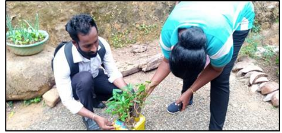
ඡායාරූප අංක 57: තිරසාර ගෙවතු වගා වැඩසටහන, රත්තොට புகைப்பட எண் 57: நிலைபேறான வீட்டுத்தோட்டச் செய்கை நிகழ்ச்சித் திட்டம், ரத்தோட்டை