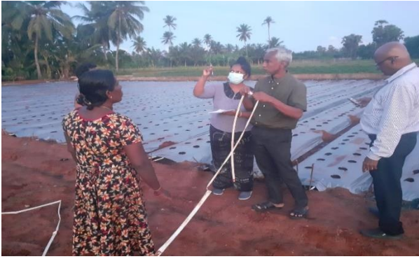
ජායාරූප අංක 13 - යාපනයේ අර්තාපල් රතු ආණු පොකුර ක්ෂේත්‍ර පිහිටුවීම புகைப்படம் எண்-13: யாழ்ப்பாணத்தில் சின்ன வெங்காயக் கொத்தணிகள் மூலம் சின்ன வெங்காயச் செய்கை Photo No-13: Red onion farming in Jaffna by Red onion cluster