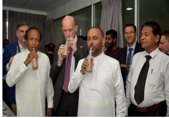
ඡායාරූප අංක 23 - කුඩා පරිමාණ කිරි සැකසුම් කර්මාන්ත ශාලාවක් නිරීක්ෂණය කිරීම, වාරියපොළ புகைப்பட எண் 23 - சிறிய அளவிலான பால் பதப்படுத்தும் தொழிற்சாலையின் அவதானிப்பு, வாரியப்பொல