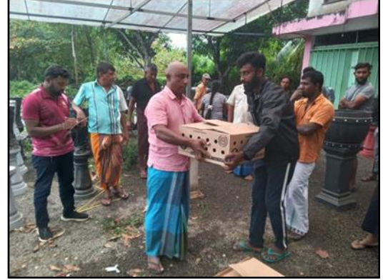
ඡායාරූප අංක 56: අර්ධ ඉහාශීත කුකුළු පාලන වැඩසටහන, බෙලේඅතේ සිටිනා මළුව උතුර ඉම නිලධාරී වසම புகைப்பட எண் 56: வீட்டுப் புறச்சூழலில் மேற்கொள்ளும் கோழி வளர்ப்பு செயற்திட்டம் - பெலியத்த சிட்டினாமலுவ வடக்கு கிராம அதிகாரிப் பிரிவு