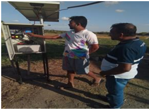
ඡායාරූප අංක 17 - වයඹ පළාතේ අඹන්පොල ප්‍රදේශයේ වගා වැට්ටක් නිරීක්ෂණය කරන අයුරු පූකෙප්පඩ எண்-17: வடமேல் மாகாண அம்பன்பொல பிரதேசத்தில் பயிர்க் காப்பு வேலையை அவதானிக்கும் போது Photo No-17: observation of modern agriculture practices, Abanpola, NW province