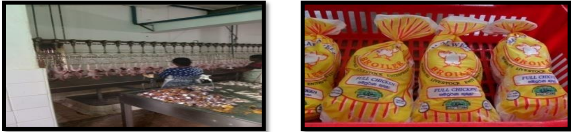
ඡායාරූප අංක 50 - බ්‍රොයිලර් කුකුළු මස් නිෂ්පාදනය ප්‍රකාශනය. 50 - පිරාය්ලර් කොච්චි ඉරුසුකරුගේ උරුමය Photo No. 50: production of broiler chicken