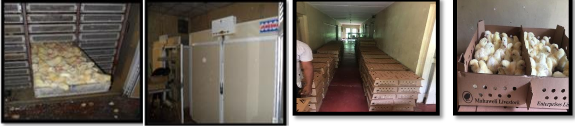
ඡායාරූප අංක 49 - දිනක් වයසැති බ්‍රොයිලර් කුකුළු පැටවුන් අලෙවිය ප්‍රකාශනය. 49 - ඉරු නාග් ව්‍යවස්ථාපිත පිරාය්ලර් ඉරුසුකරුගේ වර්ගය Photo No. 49: sale of one day chicken