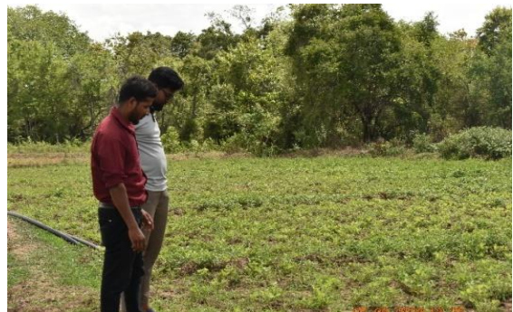
ඡායාරූප අංක 18 - උතුරු පළාතේ මුල්ලියාවලයි ප්‍රදේශයේ රටකපු වගාවක් පූකෙප්පඩம் எண்-18: வட மாகாணத்தின் முல்லியாவளைப் பிரதேசத்தில் நிலக்கடலைச் செய்கை Photo No-18: ground nut cultivation in Northern Province