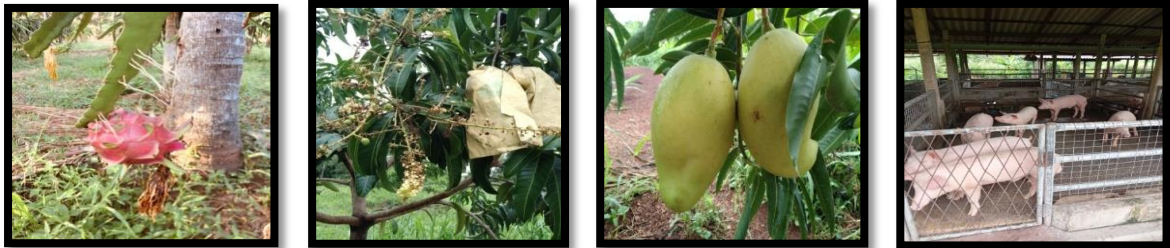
ඡායාරූප අංක 51 - වගා කටයුතු හා අනෙකුත් නිෂ්පාදනයන් ප්‍රකාශනය. 51 - ප්‍රායුර්සු සමස්තය මරුමුදු ඉරුසුකරුගේ උරුමය Photo No. 51: other productions