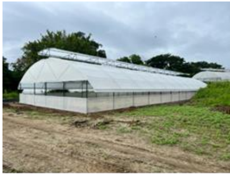
ඡායාරූප අංක 26 - කුණ්ඩසාලේ වැසි ආවරණ ගෘහ අංක 4 புகைப்பட எண். 26 - குண்டசாளை மழைக் காப்பு இல்லம் - 4 Photo No-26: rain shelter at Kundasale farm