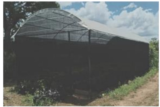
ඡායාරූප අංක 27 - අඹේපුස්ස ගොවිපලේ අලුත්වැඩියා කරන ලද වැසි ආවරණ ගෘහය புகைப்பட எண். 27 - அம்பேபுஸ்ஸ பண்ணையில் திருத்தியமைக்கப்பட்ட மழை மழைக் காப்பு இல்லம் Photo No-27: Renovated rain shelter at Ambepussa farm