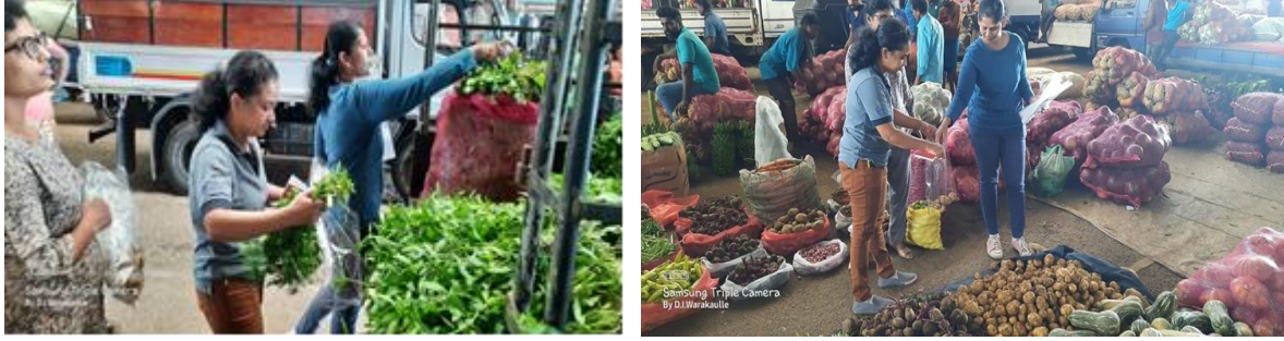
ඡායාරූප අංක 31- ආහාර දුෂිත හඳුනා ගැනීම සඳහා එළවළු, අල බෝග සහ ධාන්‍ය සාම්පල් රැස් කිරීම පූකෙට්ටාමය. 31- உணவு மாசுபடுதலை கண்டறிவதற்காக காய்கறிகள், கிழங்குகள் மற்றும் தானியங்களின் மாதிரிகள் சேகரிப்பு Photo No-31: Taking (vegetable, potato and cereals) samples, Dambulla, dedicated economic centre

vii.) කොළඹ, මාතලේ සහ පුත්තලම යන තෝරාගත් දිස්ත්‍රික්ක 3 හි ශාකමය සම්භවයක් සහිත කෘෂිකාර්මික නිෂ්පාදනවල සෞඛ්‍ය ආරක්ෂිතව සහතික කිරීම தேர்ந்தெடுக்கப்பட்ட 3 மாவட்டங்களான கொழும்பு, மாத்தளை மற்றும் புத்தளம் ஆகிய மாவட்டங்களில் தாவர மூல விவசாய உற்பத்திப் பொருட்களின் சுகாதாரப் பாதுகாப்பை உறுதி செய்தல். Ensuring the health safety of agricultural products of plant origin in the 3 selected districts of Colombo, Matale and Puttalam