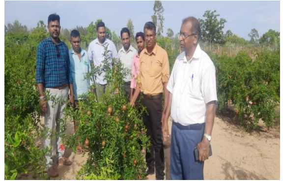
ජායාරූප අංක 14 - මඩකලපුවේ දෙළුම් පොකුර புகைப்படம் எண்-14: மட்டக்களப்பில் மாதுளை கொத்தணி Photo No-14: Pomegranate cluster in Batticaloa