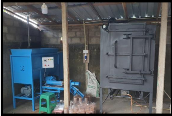
ஊராட்சி அங்க 03 - காலநிலை மாற்றத்திற்கு எதிர்ப்பு வாய்ந்த புகைப்பட எண் 03 - கொழும்பு மாவட்டத்தில் காளான் வளர்ப்பை ஊக்குவிக்கும் நிகழ்ச்சித் திட்டம்

Photo No-2: Promotion of local yam for value addition and export