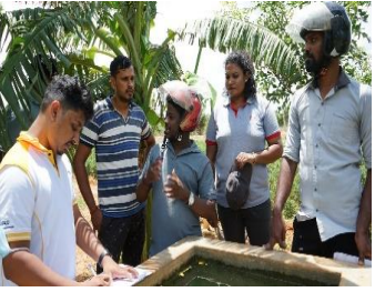
Photo No-19: Workshop for beneficiaries of Richi dairy project on financial literacy in Nugathalawa, Kandy on July 2023.

ඡායාරූප අංක 20 - 2023.09.23 වන දින යාපනය ප්‍රදේශයේ කීල්ස් ව්‍යාපෘතිය නිරීක්ෂණය කිරීම.