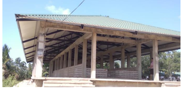
ඡායාරූප අංක 25 - අනුරාධපුර උඩමළුව හෙළ බොජුන් හල புகைப்பட எண்-25: ஹெலபொஜுன் விற்பனை நிலையம், உடமலுவ, அனுராதபுரம் Photo No-25: Hela bojun hala, Udamaluwa Anuradhapura