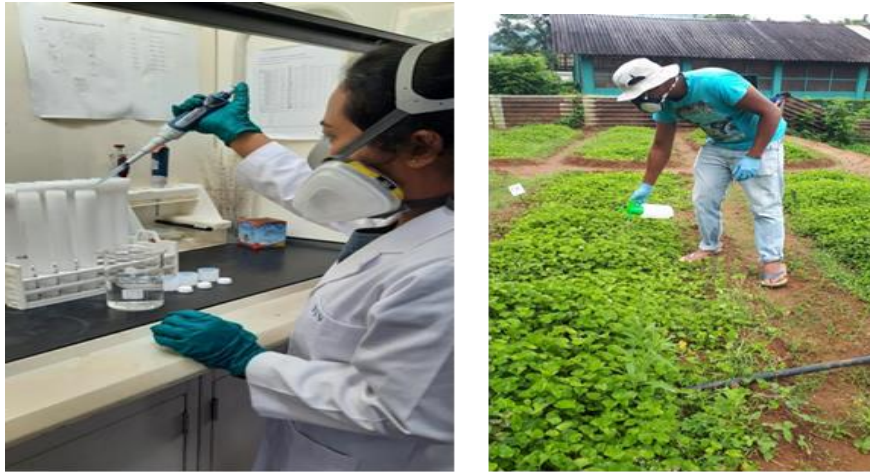
ඡායාරූප අංක 32 - ක්ෂේත්‍ර කටයුතු සහ විද්‍යාගාර පරීක්ෂා කිරීම - උද්‍යාන බෝග පර්යේෂණ හා සංවර්ධන ආයතනය, ගන්නොරුව

Determination of Mancozeb in Leafy Vegetables through Determination of Manganese (Mn) Content