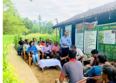
ඡායාරූප අංක 24 - ක්ෂේත්‍ර අධීක්ෂණ කටයුතු : අධි ඝනත්ව වගාව ප්‍රවර්ධනය කිරීම මගින් බඩඉරිඟු වගා ප්‍රමාණය පුළුල් කිරීම සඳහා බීජ සහනාධාර ලබා දීම - මහියංගනය, රිදිමාලියද්ද

புகைப்பட எண். 24 - களக் கண்காணிப்பு நடவடிக்கைகள்: அதிக அடர்த்தி கொண்ட பயிர்ச்செய்கையை ஊக்குவிப்பதன் மூலம் சோளச் செய்கை மேற்கொள்ளும் நிலப்பரப்பை விரிவுபடுத்துவதற்காக விதை மானியம் வழங்குதல் - மஹியங்கணை, ரிதிமாலியத்த