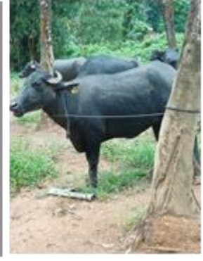
ඡායාරූප අංක 11 - මී ගව සංවර්ධන ව්‍යාපෘතිය - උතුරු පළාත ප්‍රකාශනය - 11: සංවිකල්ප වැනි ප්‍රජා සංවිකල්ප අවිකල්ප - වැනි සංවිකල්ප Photo No-11: Buffalo farm development project- Northern Province