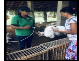
ඡායාරූප අංක 48 - මව් සත්ව ගනය වර්ධනය කිරීම புகைப்பட எண். 48 - பெற்றார் விலங்குத் தொகையை விருத்தி செய்தல் Photo No. 48: development of parent stock