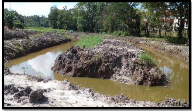
ඡායාරූප අංක 05 - සෝජන් ක්‍රමය යටතේ පුරන් කුඹුරුවල කෘෂි බෝග ව්‍යාප්ත කිරීමේ වැඩසටහන ප්‍රකාශනය. 05 - சோஜன் முறையின் கீழ் தரிசு நிலங்களில் விவசாயப் பயிர்களின் விரிவாக்க நிகழ்ச்சித் திட்டம்